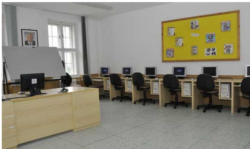
Učebna výpočetní techniky 3