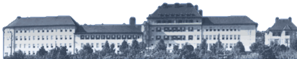
Hotelová škola Světlá a Střední odborná škola řemesel Velké Meziříčí U Světlé 855/36, 594 01 Velké Meziříčí