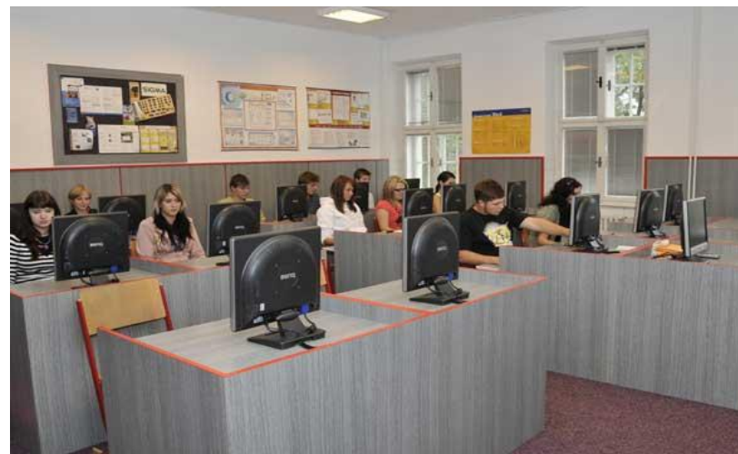
Učebna výpočetní techniky 1