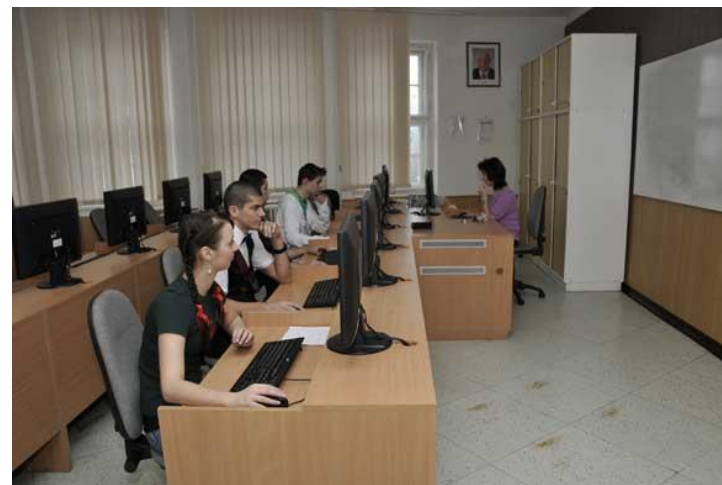
Učebna výpočetní techniky 2