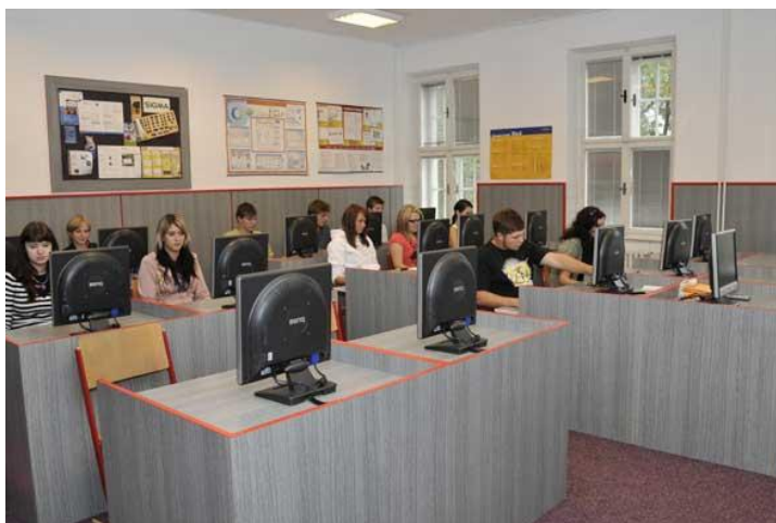
Učebna výpočetní techniky 1