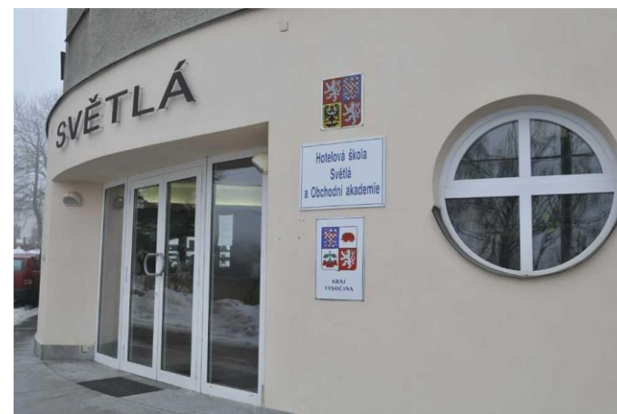
Hlavní vchod do budovy školy