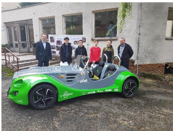
Předávání sponzorských darů